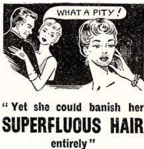
Figure 2 | Publicité injonctive sur l'apparence des femmes

Les normes injonctives ont aussi été étudiées séparément comme facteurs comportementaux puissants. Les normes injonctives se trouvent notamment dans les publicités ; très souvent, les publicités injonctives sont liées aux rôles de genre (figure 2). Les messages injonctifs ont tendance à façonner les idées de l'effet que cela fait d'être une personne approuvée : utiliser le produit adéquat vous rendra populaire, sympathique ou accepté. Il existe des études sur les normes injonctives 21 bien que les chercheurs aient généralement intégré dans leurs études empiriques les analyses des normes injonctives et descriptives. La plupart des études ont examiné les effets combinés et relatifs des normes descriptives et injonctives. Les données relatives à la norme la plus forte ne sont pas assez claires, suggérant que la différence dans la force de leur influence pourrait être due au comportement influencé, autant qu'aux caractéristiques de la population influencée par la norme (âge, genre ou statut économique), les relations entre les influenceurs et les influencés (distance ou proximité sociale perçue), ou les caractéristiques du contexte dans lequel les influencés vivent (milieu urbain ou rural, familial ou inconnu par exemple). 22