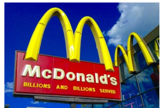
Figure 1 | Preuve sociale sur un panneau

Les normes descriptives et injonctives peuvent être des facteurs puissants de comportements quand elles fonctionnent de façon indépendante ou collective. Les experts en annonce publique ont utilisé l'influence des normes descriptives pendant des années : lorsque les gens croient que plusieurs autres se comportent d'une façon donnée, ils seront susceptibles d'en faire de même (figure 1). Des données plus empiriques sur l'influence des normes descriptives proviennent d'études menées dans des pays à revenu élevé, dont la plupart ont été menées par des chercheurs qui visent : 1) l'augmentation de comportements pro-environnementaux ; 19 et 2) la réduction de la consommation d'alcool dans les campus universitaires. 20